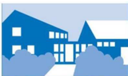
Karl-Lemmermann-Haus - Sozialpädagogisch betreutes Wohnen - e. V.

Trägerschaft: Werkheim e.V., Diakonieverband Hannover-Land, Karl-Lemmermann-Haus e.V., Diakonisches Werk Hannover, Selbsthilfe für Wohnungslose e.V.