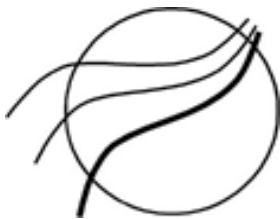
Grafiken: Karin Saberschinsky In: Pfarrbriefservice.de

Text: Irmela Mies-Suermann In: Pfarrbriefservice.de